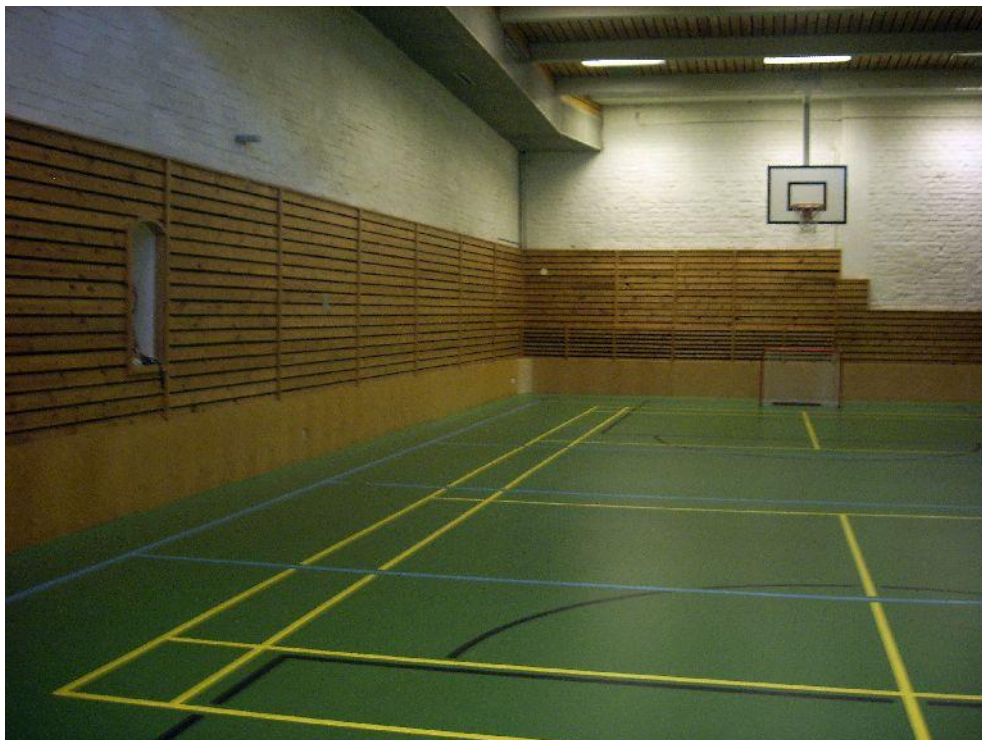
Jokelan vankila, isä-lapsi -ryhmien tila