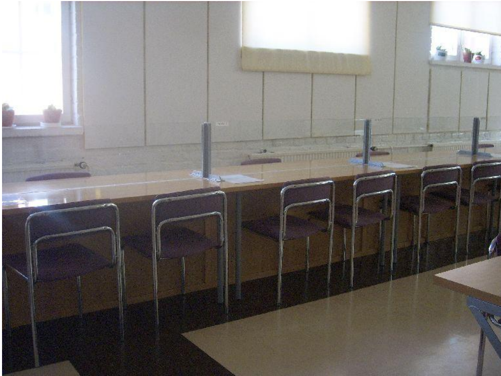
Jokelan vankila, normaalitapaamistila