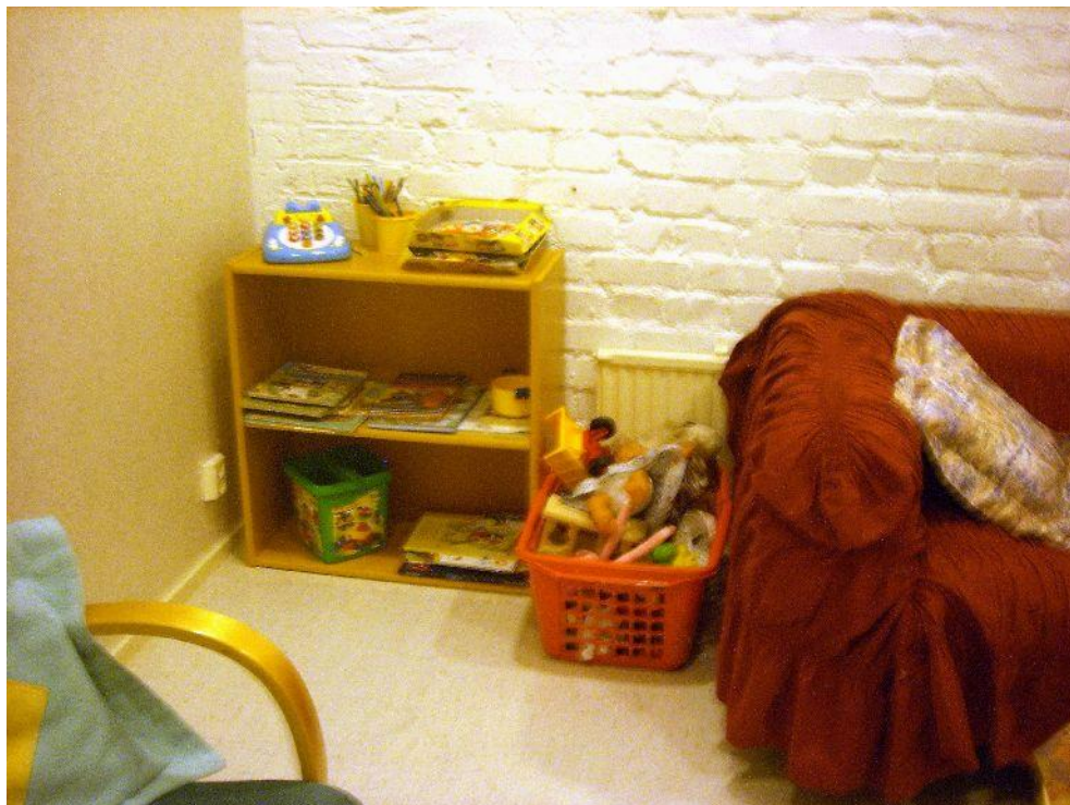
Jokelan vankila, ikkunaton "pikkuhuone"